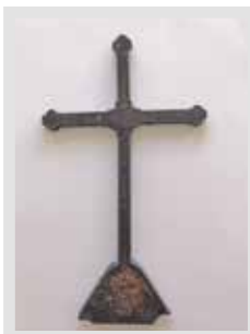
Sandra Gerosa 1934 – 2 agosto 2025 Tesserete