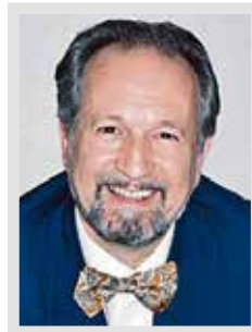
Quadri Gabriele 1950 – 28 giugno 2025 Caglio