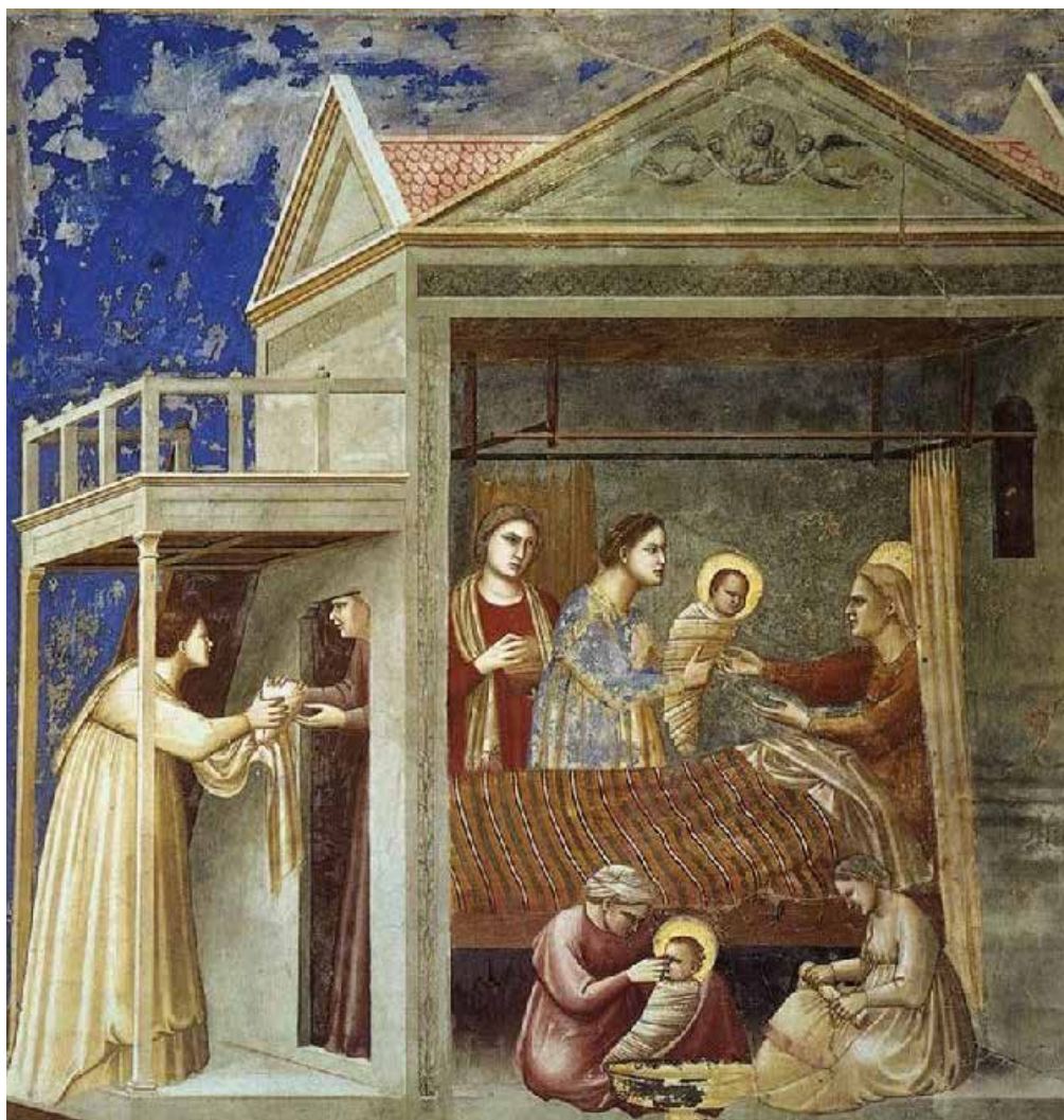
Giotto (1266 - 1337): Natività della Vergine (1304)